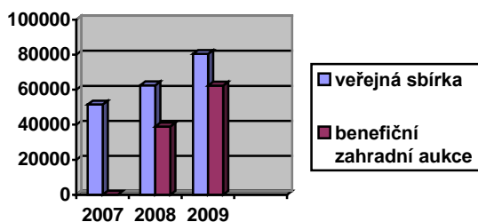
Graf: finanční výnos Zlínské akce cihla