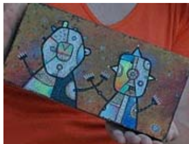
Zdeněk Frýz, 09